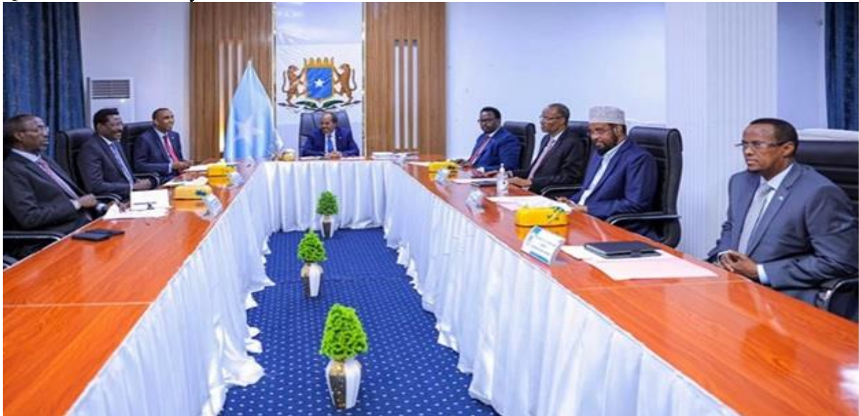
Shirka Golaha Wadatshiga Qaranka (GWQ), 27 May, 2023 Muqdisho.

Qoraalkani waa isku day lagu iftiiminayo cakirnaanta soo jeedintii dib u eegista dastuurka ee ay dhawaan 27/05/2023 soo saareen Golaha Wadatashiga Qaran (GWQ) oo ka koobnaa Madaxweyne Xasan Sheekh Maxamuud, RW Xamse Bare, RW- ku xigeen Saalax Jaamac iyo afar madaxweyne Dowlad-Goboleed oo kala ah, Madaxweynaha Jubbaland Axmed Maxamed Islaam (Axmed Madoobe), Madaxweynaha Hirshabeelle Cali C/laahi Xuseen (Guudlaawe), Madaxweynaha Galmudug Axmed Cabdi Kaariye (Qorqoor), Madaxweynaha Koonfur Galbeed, C/casiis Xasan Maxamed (Laftagareen) iyo Guddoomiyaha Gobolka Banaadir ahna Duqa Magaalada Muqdisho Yuusuf Xuseen Jimcaale (Madaale). Kulankan ayaa waxaa ka maqanaa Madaxweynaha Puntland Siciid Cabdullaahi Deni oo markii dambe ka soo horjeestay soo jeedinta, iyadoo maqnaanshihiisa la sheegay inay la xiriirto khilaaf siyaasadeed oo soo kala dhexgalay isaga iyo Madaxtooyada Qaranka oo aan ilaa iyo hadda xal loo helin.